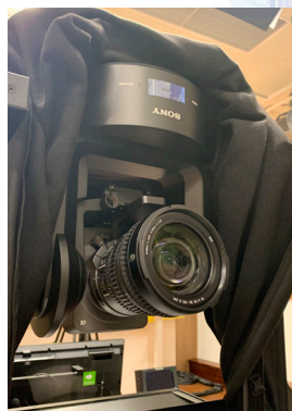
Cinema Lineカメラ SONY ILME-FR7

このクオリティで且つ、コスト削減にも貢献出来るとあって、専用リモートコントローラー SONY「RM-IP500」と共に、最新のスタジオカメラシステムの導入をご決断される、決め手となったと聞いております。