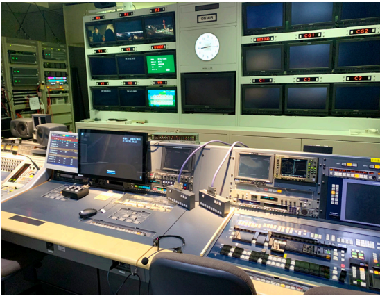
既設システム設備に順応

導入後の細かな対応にもご評価をいただき、ソニーマーケティング様と共にご満足いただけるシステムの納入ができました。