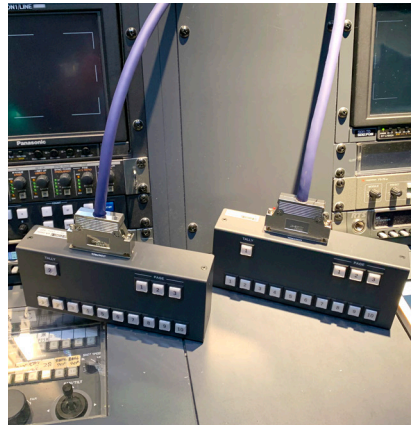
使いやすい位置に操作パネルを配置