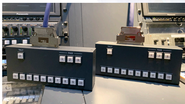
特注で製作したオリジナルプリセットコントローラー

今回、オリジナルのプリセットコントローラーのご導入をご検討されたのは、カメラを操作するディレクター様が、かんたんにシンプルに、間違いなく操作できことが求められていたためでした。標準のコントローラーでも同様の操作はできますが、失敗が許されない運用の中で、オペレーター様は直感的、かつシンプルに操作できるパネルを必要とされていました。この要望に応えるため、自社製品開発でお客様のご意見に寄り添ってきた経験と技術力で、ネットワークカメラの制御の応用で、ご要望の機器のご提供を短納期で適えることが無事にできました。