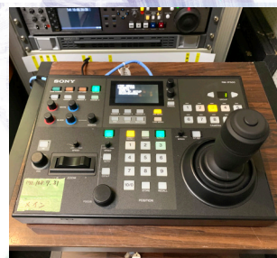
リモートコントローラー SONY RM-IP500