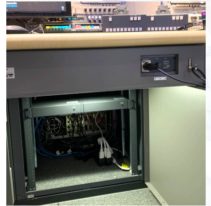
本体ユニットは卓下ラックに収納